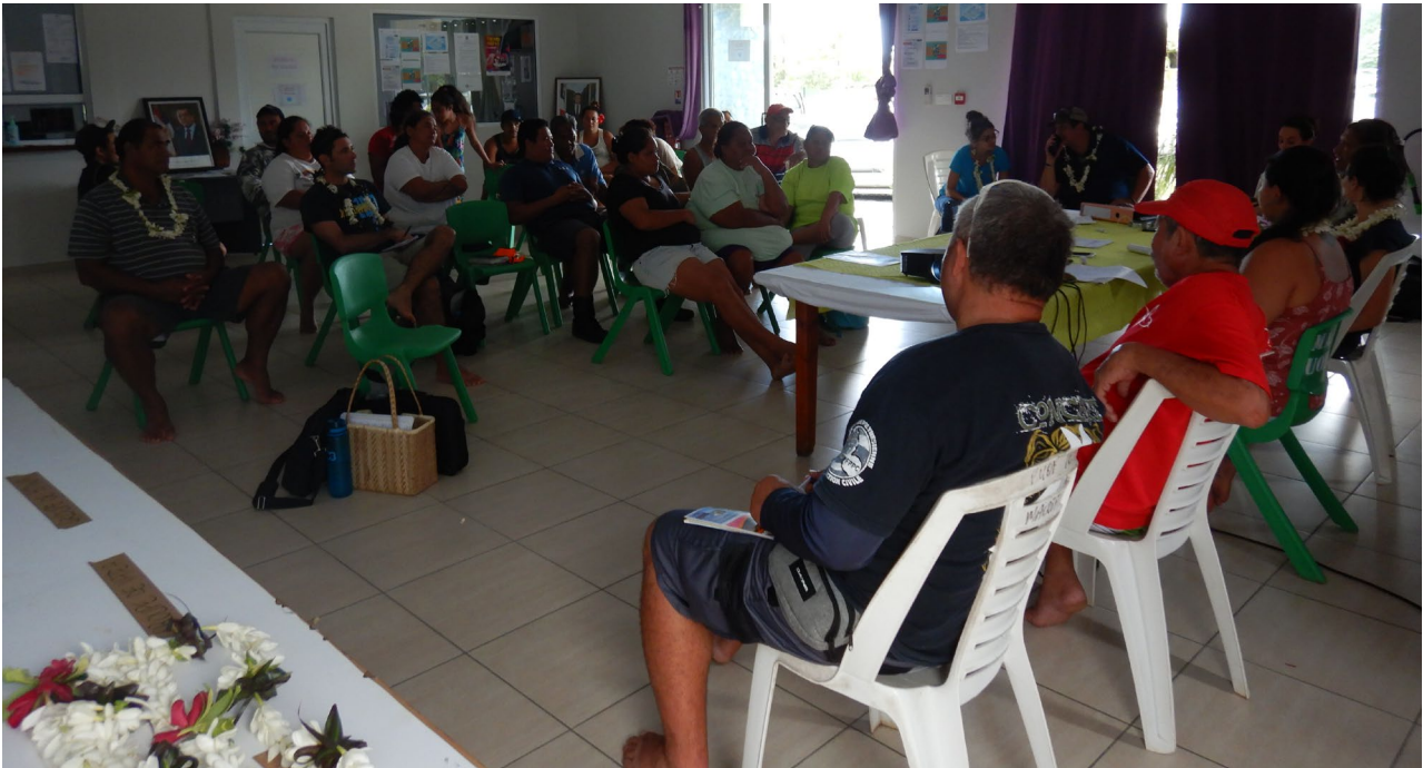
Figure 2: Réunion du comité de gestion de la ZPR de Puohine.