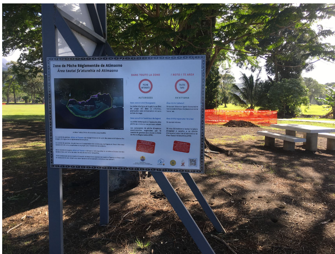
Figure 4: Panneau d'information installé au niveau du domaine de Atimaono afin d'informer la population de l'emplacement et des règles de la ZPR de Atimaono.

la conception des visuels de panneaux d'information et de flyers pour la ZPR de Puohine. Ces supports ont été imprimés et envoyés à Raiatea.