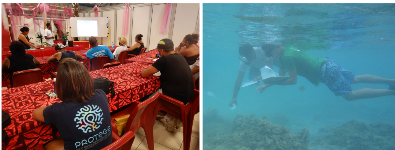
Figure 5: Formation au suivi participatif des membres du comité de gestion de la ZPR de Atimaono.