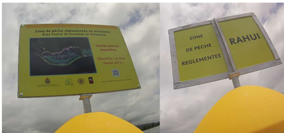
Figure 3: Photo d'un panneau-mer installé au niveau de la ZPR de Atimaono en novembre 2020.

Durant le second semestre 2020, les travaux de balisage de 3 ZPR ont été réalisés (Atimaono, Rahui no Patere i Papara et Mataiva). De plus, les consultations pour les marchés de travaux de balisage des ZPR de Puohine et Arutua ont été lancées. Les offres ont été analysées et les marchés ont été attribués. Les travaux de pose de balisage de ces 2 ZPR débuteront en Janvier 2021.