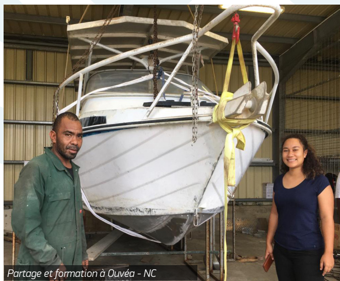
Partage et formation à Ouvéa - NC

J'ai bénéficié d'une formation par immersion de quinze jours en Nouvelle-Calédonie très intense avec pour objectif principal le partage d'expériences entre Wallis et Futuna et la Nouvelle-Calédonie. J'ai commencé ma formation à la province des Îles Loyauté et plus précisément à Ouvéa en rencontrant le syndicat des pêcheurs et en visitant l'UCPM (Unité de Conditionnement des Produits de la Mer) ce qui était très important car c'était une demande forte de nos pêcheurs professionnels à Wallis et Futuna pour avoir un retour de ces professionnels. Grâce à l'accompagnement de la province Nord, j'ai pu ensuite aller sur le terrain jusqu'à Poum avec les techniciens et rencontrer les pêcheuses à pied. Actuellement, ils sont en plein renouvellement des autorisations de pêche et j'ai pu constater que c'était un système très différent du nôtre dont je ferais part à notre service des pêches à Wallis pour améliorer nos procédures de retour au Fenua. Accompagnée ensuite par la province Sud, nous avons pu évoquer les aides, les formations et le développement de la