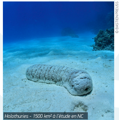
Holothuries - 1500 km 2 à l'étude en NC

L'objectif de cette journée était de former l'ensemble des acteurs à la même technique d'échantillonnage des holothuries. Cet échantillonnage s'étalonne de fin avril à fin juillet 2021 et couvrira une surface de 1500 km 2 sur différents sites de Nouvelle-Calédonie. La finalité de l'étude est de fournir des recommandations sur les quotas d'export d'holothuries, espèces prisées dans le commerce extérieur asiatique, en veillant à préserver les ressources marines.