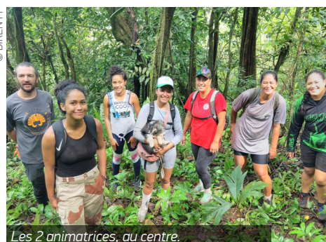
Les 2 animatrices, au centre.

Sensibilisation aux EEE sur le site UNESCO de Paysage Culturel Taputapuatea - PF : En fin d'année 2020, deux animatrices locales, habitant au sein du périmètre du site UNESCO Paysage Culturel de Taputapuatea ont été recrutées et formées afin de mener à bien leurs futures missions de sensibilisation des populations aux enjeux de la lutte contre les espèces envahissantes. Une formation pratique aux