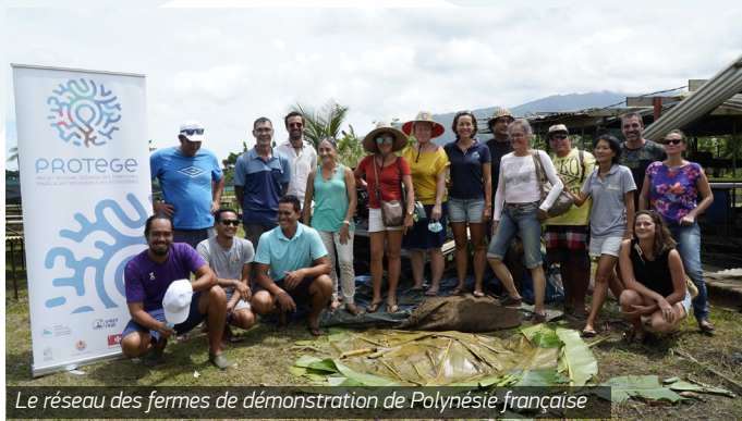
Le réseau des fermes de démonstration de Polynésie française

J'ai une exploitation à Papara de 2 hectares de maraîchage en agriculture biologique. J'ai voulu candidater en tant que ferme de démonstration, d'abord, pour devenir un exemple pour la jeunesse. Moi, je suis jeune et j'ai envie de transmettre cette envie de se lancer dans l'agriculture et d'en vivre. J'aimerais aussi que les légumes bio soient accessibles à tous. Mon objectif, c'est que les gens qui n'ont pas beaucoup d'argent puissent aussi acheter bio. C'est vrai que l'agriculture biologique demande plus de main d'oeuvre et je voudrais travailler sur les charges et le temps de travail notamment grâce à ce réseau.